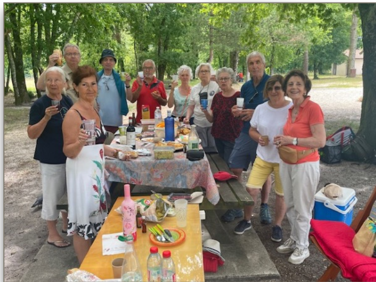
Un pique-nique bienvenu après l'effort