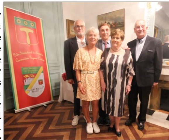
Nos impétrants présents